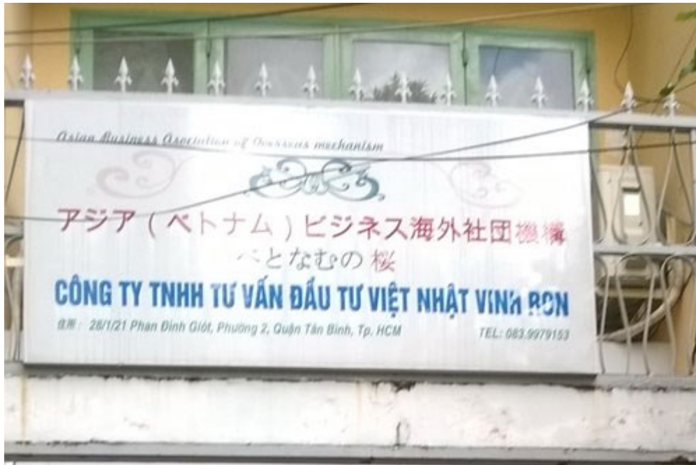
Trụ sở Công ty Tư vấn đầu tư Việt Nhật Vinh Ron ở đường Phan Đình Giót, Tân Bình (TP.HCM)

(TNO) Mặc dù không có chức năng xuất khẩu lao động nhưng Công ty TNHH Tư vấn đầu tư phát triển Việt Nhật Vinh Ron (gọi tắt là Công ty Vinh Ron) ở số 28/1/21 Phan Đình Giót, phường 2, quận Tân Bình, (TP.HCM) vẫn ồ ạt tuyển học viên với lời hứa đưa đi xuất khẩu lao động tại Nhật Bản.